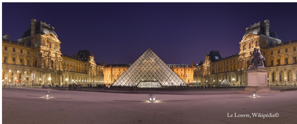
Le Louvre

Quand ils sortent du Louvre, ou au cours de leur visite, les PJ réussissant un test facile d'Intellect / Vigilance avec Ésotérisme à Apprenti s'apercevront que la fameuse pyramide est composée de 666 éléments de verres qui capturent et concentrent la lumière du soleil... Ils peuvent dès maintenant se douter de ce qui va se passer dimanche, à l'aube.