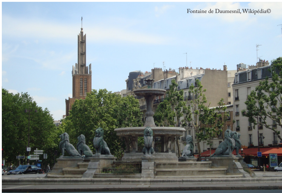
Fontaine de Daumesnil

La nuit suivante, Nefertiti en personne vient voir le vieux à son tour, mais trop tard, l'amulette n'est déjà plus là. Pour qu'Affad ne puisse pas parler, et ne devienne pas fou (on a beau être mystique, la vision de Nefertiti dépasse les bornes) Nefertiti l'hypnotise de façon à le jeter dans l'extase. Le vieux arbore dès lors un sourire béat, envoûté par la sublime image de la belle égyptienne. Si les PJ reviennent le voir, ou si le petit élémentaire de lune, inquiet, les ramène chez lui, il ne pourra que murmurer : « la belle est venue ». Ce qui est la signification littérale de Nefertiti en égyptien (test normal d'Intellect / Linguistique).